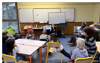
Galette des rois et jeux avec le péricolaire